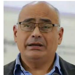
Carlos Alvarado - Nuevo ministro

Doctora con amplia trayectoria en el sector sanitario y directora de la fundación del Cardiológico Infantil.